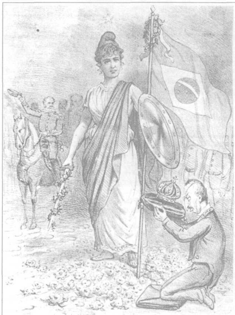
Revista Ilustrada , 16 nov. 1889.

47. Observe o cartum abaixo, que faz referência à proclamação da República no Brasil.