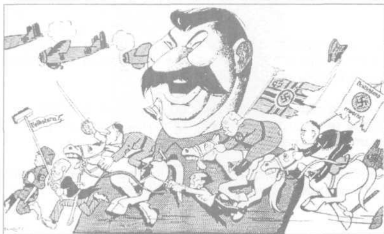
BELMONTE. Caricatura dos tempos. São Paulo: Melhoramentos, 1982.

50. Observe a charge abaixo, do cartunista brasileiro Belmonte.