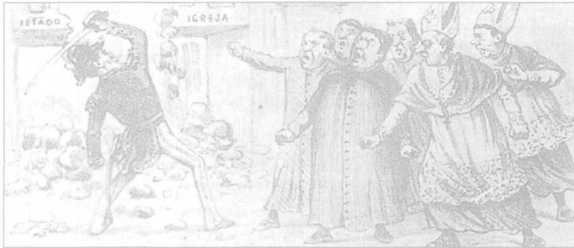
VICENTINO, Cláudio; DORIGO, Gianpaolo. História do Brasil . São Paulo: Scipione, 1997. p. 257.

A charge acima faz referência à chamada "Questão Religiosa", ocorrida durante o Segundo Reinado. Essa disputa entre o Estado Imperial e a Igreja Católica aconteceu devido à